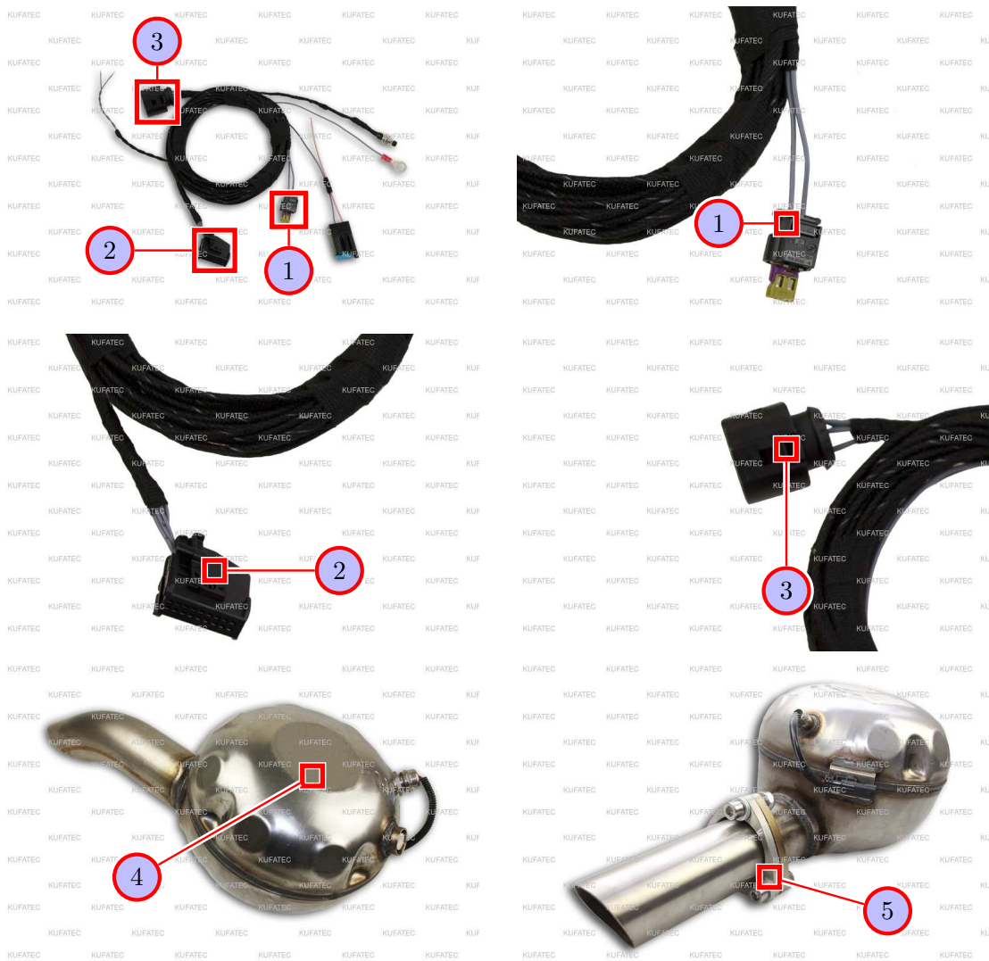
Abbildung 2: Anschluss Kabelsatz / Montage Geräuscherzeuger